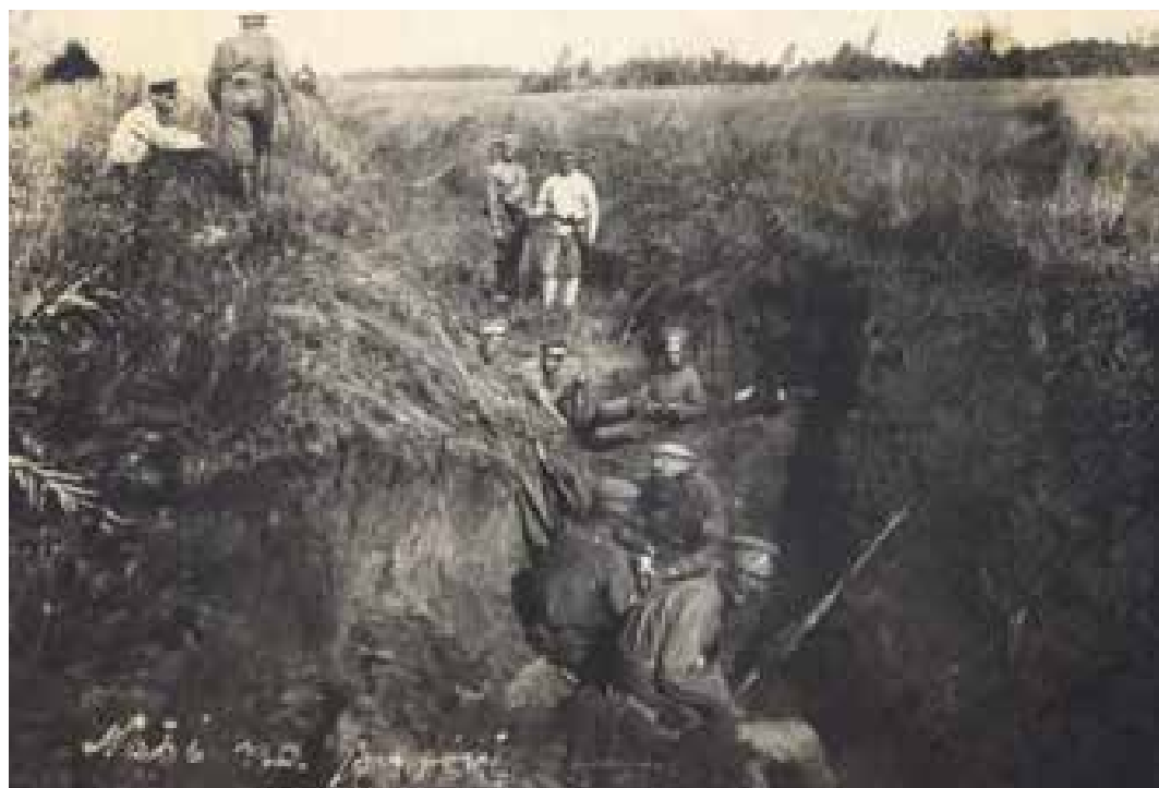
Naši na pozici, 1918