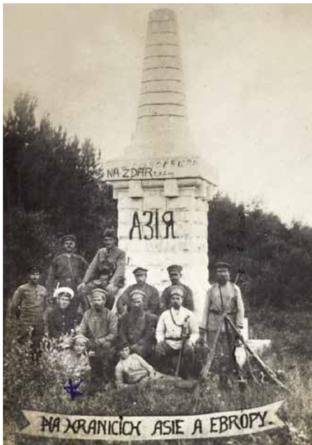
Na hranicích Evropy a Asie, 1918. Mlčoch je označený hvězdičkou.